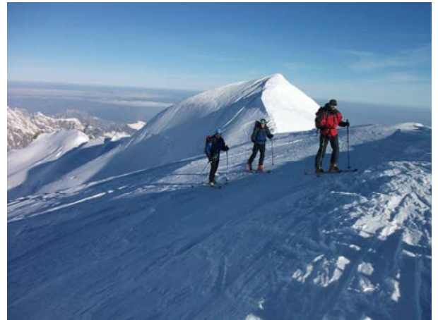
Ilegando al Abeni Flue