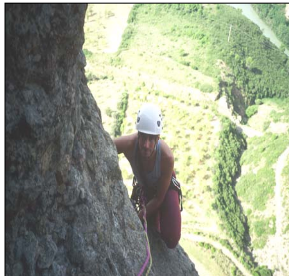
Foto salida de la Panza el 2º largo.

El descenso se realiza por los rapeles equipados del Puro. Prestar atención al viento y con dos cuerdas de 60 m se llega al rapel de la canal-chimenea