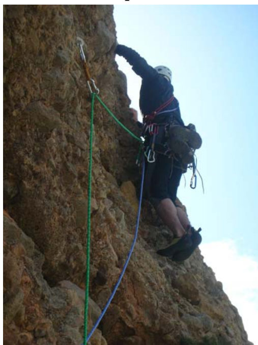
Travesia Muro final