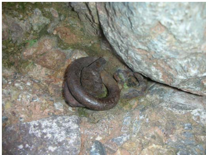
Reliquia del Pasado