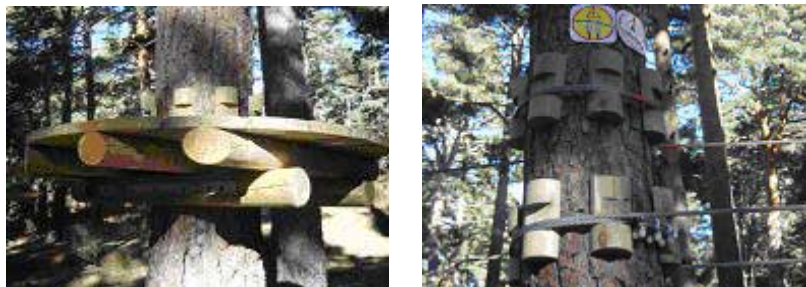
Sistema de protección de los árboles.

El sistema constructivo permite la instalación de plataformas y juegos de una manera no-intrusiva, es decir, no se clava nada que pueda dañar a los árboles. Este sistema funciona por un sencillo mecanismo de presión sobre el perímetro del árbol y garantiza con toda fiabilidad la presencia de 4 personas sobre las plataformas.