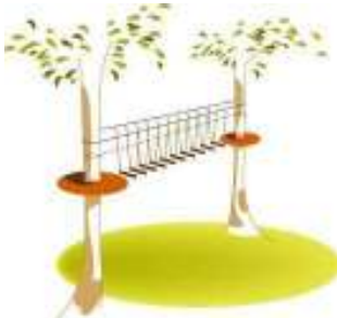
Paso de Gigante