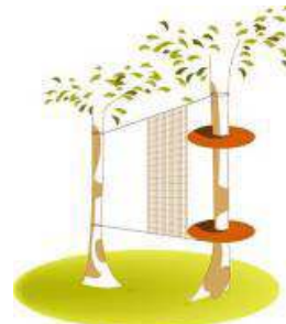
Camino de redes