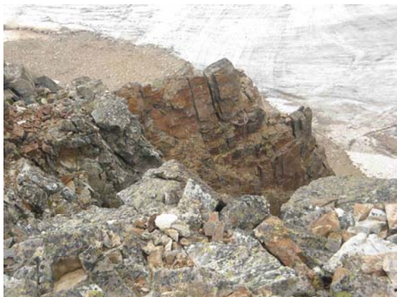
Instalación rapel a no usar