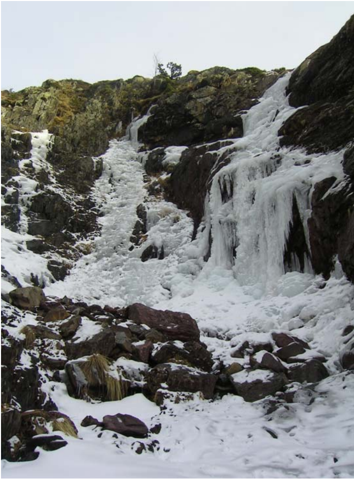
ASPECTO DE LAS CASCADAS