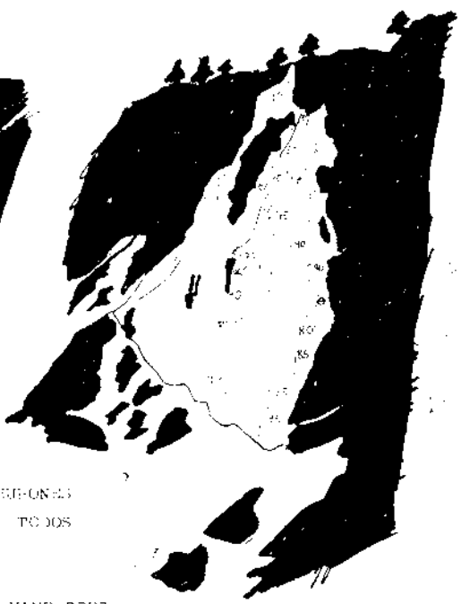
CHIBONDES PARA TODOS