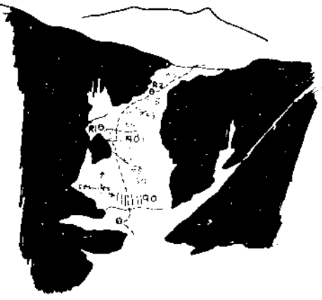
RECUERDO DE ANDALUCIA