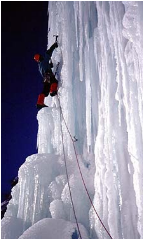
Sul candelone di Fuego Lento

Discesa: doppia da 50m sul Candelone di Fuego Lento