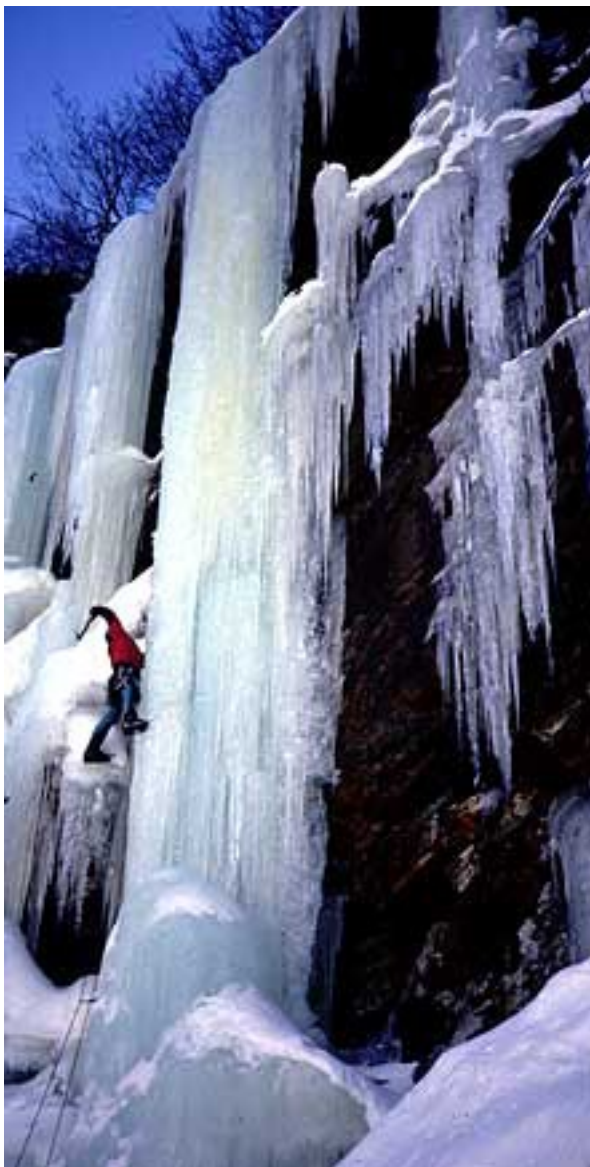
Gattoa 9 code

2. Kuzo 60m (II, 5+) ED P. Gidaro, N. Berzi e A. Sarchi Avvicinamento 0.25h