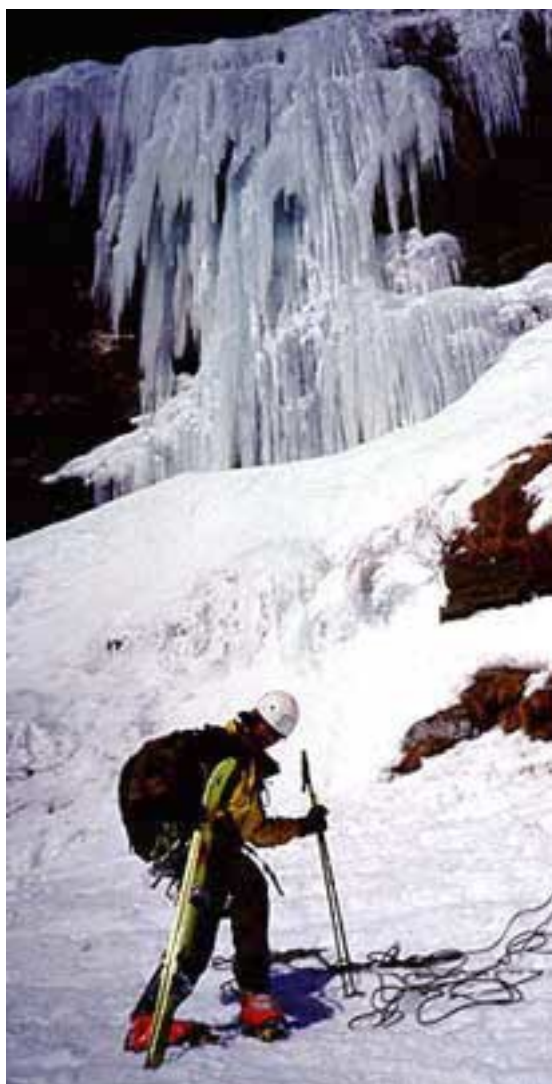
Gatto a 9 code

N.B. Altre 3 cascate da salire in questo settore.